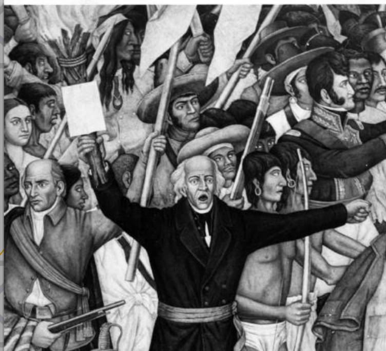
Fototeca Nacional INAH, "Don Miguel Hidalgo, detalle del Retablo de la Independencia de O'Gorman, 1965"

Nota alusiva al mes de septiembre Na mezhe o mama nu zanu/septiembre