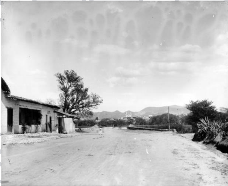
"Paraje rural, vista general, 1910-1920".

Nge kja ne kura Ngemoru, kja na informe ke o dyosu na mbokjimi, k'e ñanto e noviembre ne 1810, jingua ngaraji e Hidalgo kja in Jyapju, dyo jña'a y'ut'u ne tata kja Jyapju, por aludir pje ne mbokjimi ne kja Villa pjenga ngeje na bezo Kjo na pjunkju tsje'e, debió dar na ejemplo ne e Eleazar o sea na tr'í'i ne díosy, Mbero dya o kjaji, pjenga k'a ngampa e Hidalgo con me ri maju.